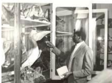
11. kép: Tanzániai hallgató gyakorlati vizsgára készül, 1972