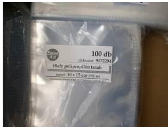
14. kép: A rendezéshez beszerzett iSafe-tasakok