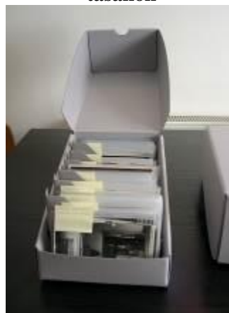
16. kép: Tárolódobozba rendezett képek

A fotógyűjtemény rendezése jelenleg is folyik.