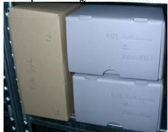
9. kép: Az átrendezett Roth-hagyaték a tárolási helyén