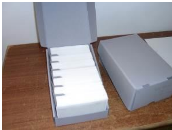
8. kép: A Roth-hagyaték átrendezése 4.