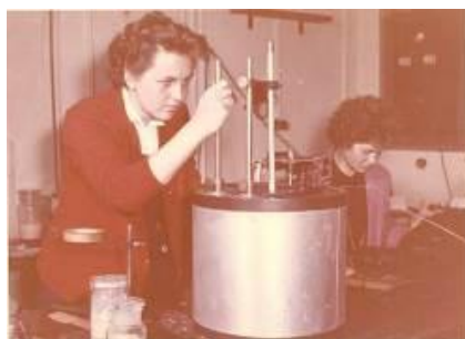
10. kép: Talajtani gyakorlat, 1960-as évek

Néhány kép a fotólaboratórium anyagából ( 10-12. kép ):