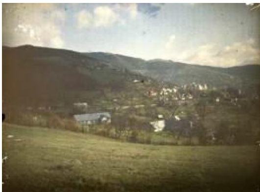
2. kép: Selmecebányai látkép 1910 körül, Roth Gyula hagyatéka. Színes üvegpozitív