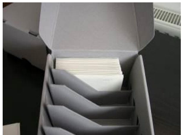
7. kép: A Roth-hagyaték átrendezése 3.