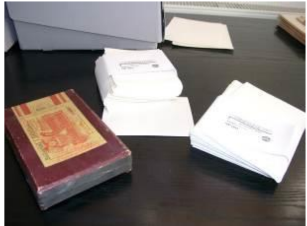
5. kép: A Roth-hagyaték átrendezése