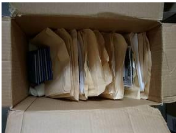
13. kép: Példa a Fotólaboratórium anyagának korábbi tárolására