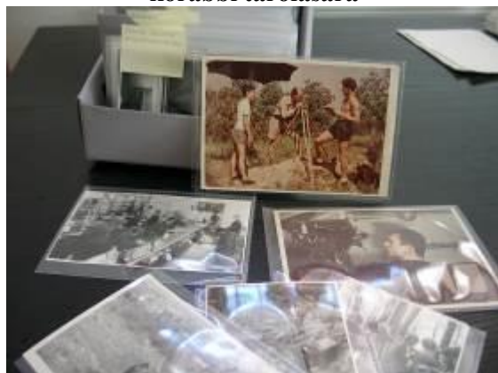
15. kép: A PP-tasakokba rendezett képek