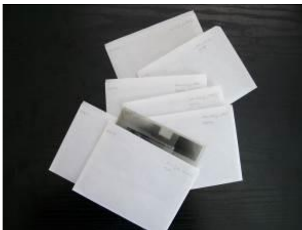
6. kép: A Roth-hagyaték átrendezése 2.