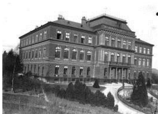
3. kép: Erdészeti palota, Selmecebányai, 1905 körül. Roth Gyula hagyatéka. Üvegnegatívról digitálisan előhívott felvétel

A fotóhagyatékot, mielőtt levéltárunkba került, évtizedeken át szakszerűtlen körülmények között tárolták. Az eredeti dobozok sérültek, elkoszosodtak (4. kép). A negatívok nagy részét tasak nélkül helyezték a dobozokba vagy a borítékokba. Az NKA pályázaton elnyert támogatásnak köszönhetően megkezdhattuk a fotóhagyaték rendezését (5-8. kép). Az értékes gyűjtemény darabjai a nemzetközi ajánlásoknak megfelelő, savmentes papírtasakokba kerültek, a tároló dobozokban biztonságosan őrizhetőek (9. kép).