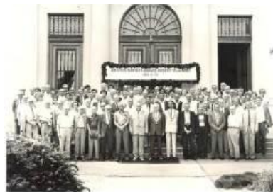
12. kép: 40 éves bányász-kohász-erdésztalálkozó, 1986