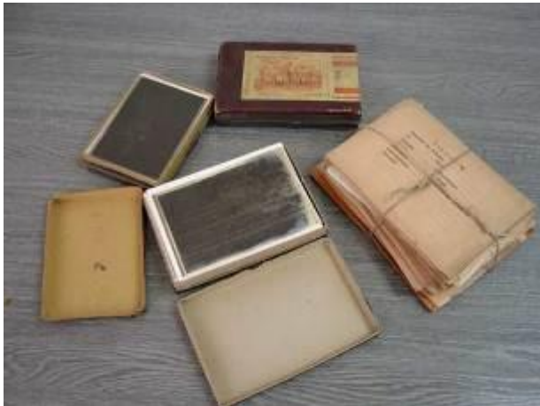
4. kép: Példa a Roth-hagyaték egykori tárolására